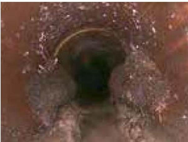
Schmutzwasserkanal mit Wurzeleinwuchs vor Einbau des Schlauchliners

Das Ergebnis ist ein Schmutzwasserhauptkanal mit einer vollständig neuen Innenauskleidung (siehe folgende Fotos). Jetzt ist das Risiko für die Bildungen von Verstopfungen und der Austritt von Abwasser stark reduziert.