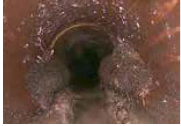
Wurzeleinwuchs im Kanal