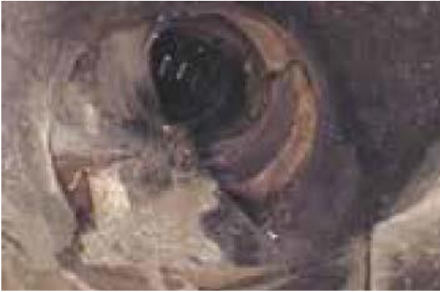
Risse und Scherben im Kanal